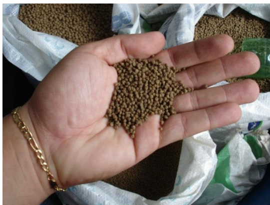
Figura 2. Ração extrusada para peixes.