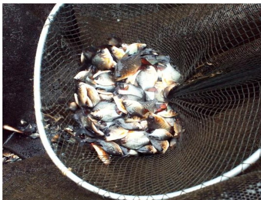
Figura 1. Alevinos, insumo da piscicultura.