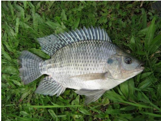
Figura 5. Tilápia Oreochromis niloticus , espécie exótica.