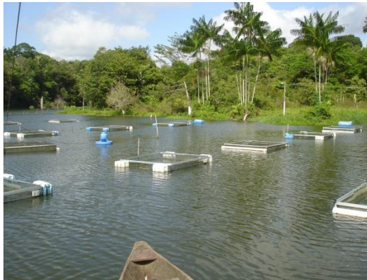
Figura 7. Tanques-rede de pequeno volume.