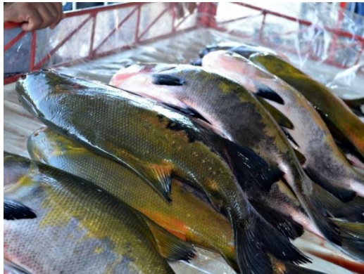
Figura 4. Comercialização de tambaqui inteiro fresco.

O Estado do Pará possui entrepostos de pescado capazes de beneficiar a produção piscícola, inclusive com selo de aprovação do Serviço de Inspeção Federal (SIF). Contudo, não é comum que o peixe oriundo da piscicultura passe pela indústria, o que limita a variedade de produtos disponíveis para o consumidor final. Essa situação deve-se principalmente a dificuldade dos piscicultores em combinar quantidade, qualidade e regularidade no fornecimento.