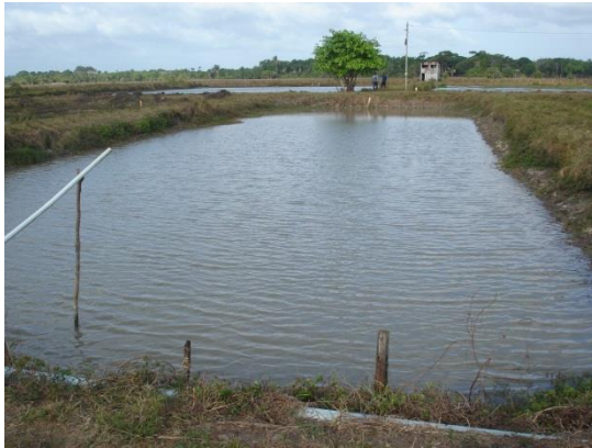
Figura 6. Viveiro escavado sem aeração artificial.