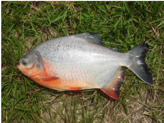
Figura 3. Pirapitinga ou caranha Piaractus brachypomus .

Tambaqui ( Colossoma macropomum ), pirapitinga ( Piaractus brachypomus ), tambacu ( Colossoma macropomum x Piaractus mesopotamicus ), tambatinga ( Colossoma macropomum x Piaractus brachypomus ); piauçu ( Leporinus macrocephalus ); pintado ( Pseudoplatystoma reticulatum x Leiarius marmoratus ); pirarucu ( Arapaima gigas ); curimatã ( Prochilodus lineatus ); matrinxã ( Brycon amazonicus ); e tilápia ( Oreochromis niloticus ).